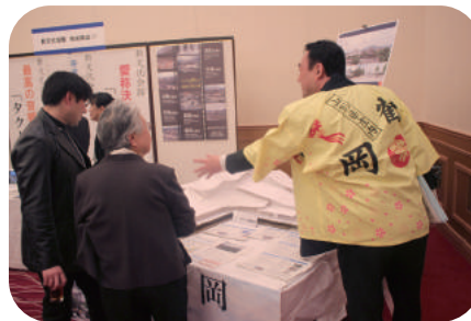
新文化会館の模型展示