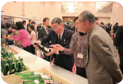
酒蔵の自慢の新酒を紹介