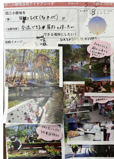
作成したアイデアシート