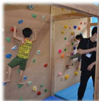
アクティブルームの安全確保