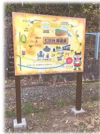
七日台周遊路案内板