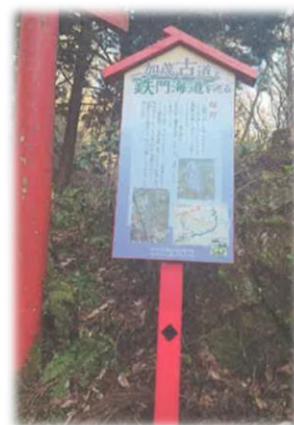
加茂古道 案内看板