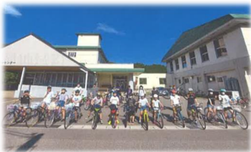
田川太郎の里 サイクリングツアー

令和2年度、3年度に歴史資料展示室、収蔵室、ガイドプレート、散策マップ等が整備されたことで、当地域を訪れる人が増えてきている。また、令和4年5月に初実施した「田川太郎の里歴史ウォーク」イベントには、募集定員の3倍もの応募があり、徐々に事業の効果が出始めてきている。