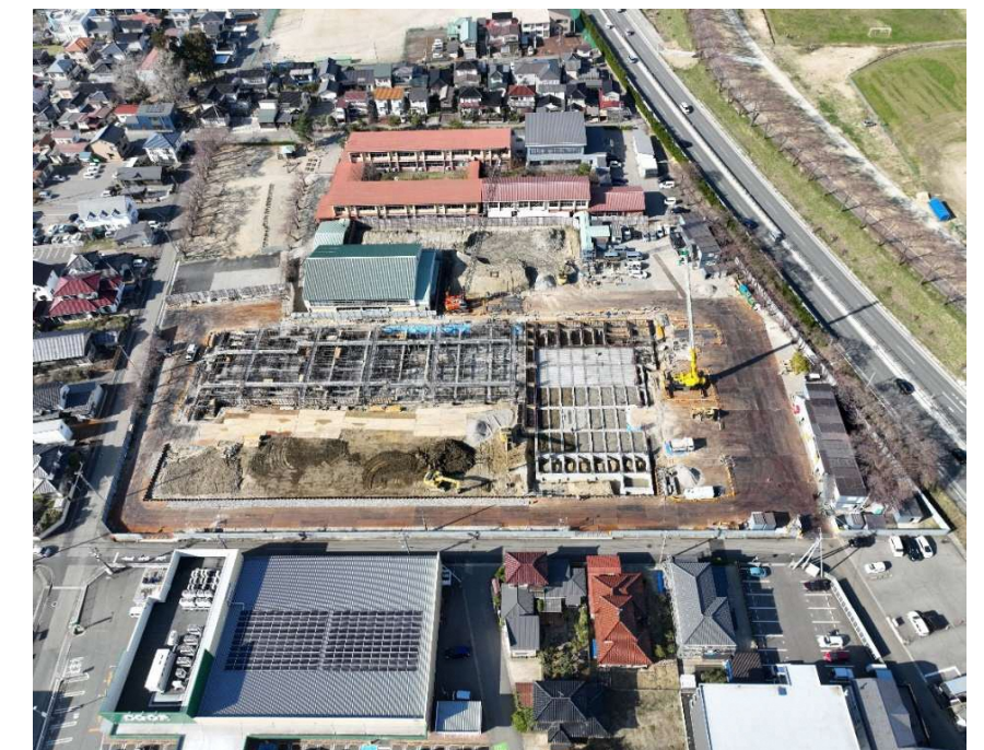
基礎工事状況を上空から撮影した写真です。