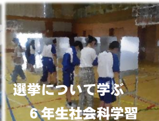
選挙について学ぶ