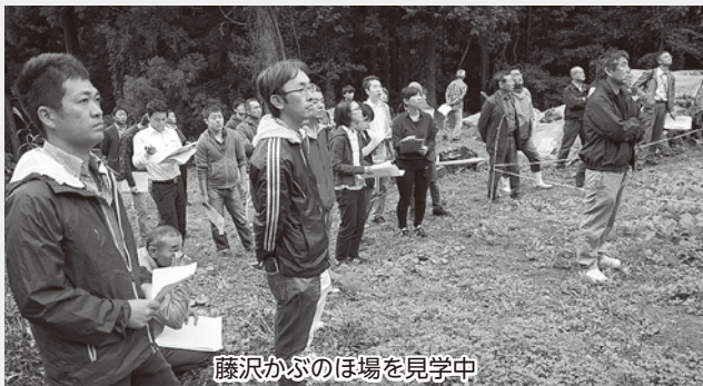
藤沢かぶのほ場を見学中