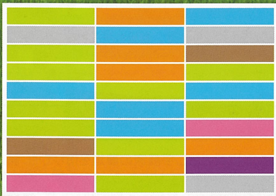
分散した農地利用