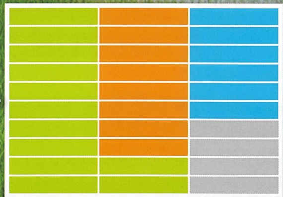
集約化した農地利用