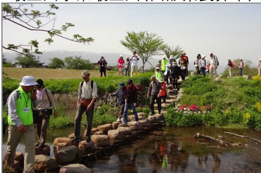
「かわ」と「まち」をつなぐフットパスルートの創出を河川管理施設の整備により支援