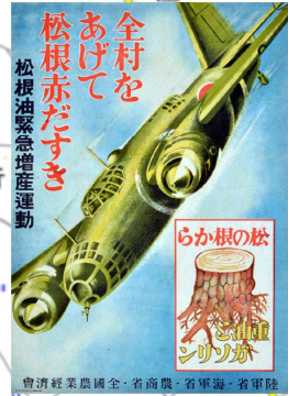
會経経業農國全・省商農・省軍海・省軍陸 岐阜県 垂井町教育委員会

鶴岡市の児童の学童疎開 昭和20年7月、空襲の危険が予想される中で、朝陽第二小の児童147人が、羽黒地区に集団疎開をしました。 「鶴岡市史 中巻」