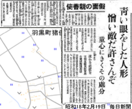
昭和18年2月19日 毎日新聞