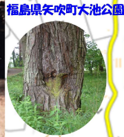
福島県矢吹町大池公園

しょうこんゆ 松根油 太平洋戦争末期に石油が乏しくなった日本は、飛行機の燃料として、松根油を利用しようとしていました。