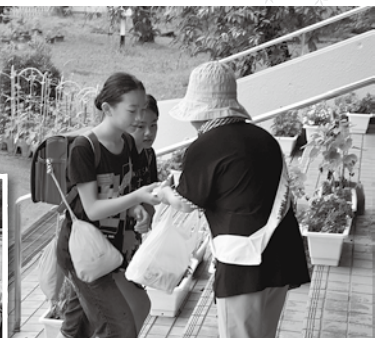
〈各小学校及び中学校〉

民生児童委員や保護司会、更生保護女性会、青少年育成推進員が中心となり、登校する児童たちにあいさつしながら、交通安全や夏の事故防止について呼びかけました。