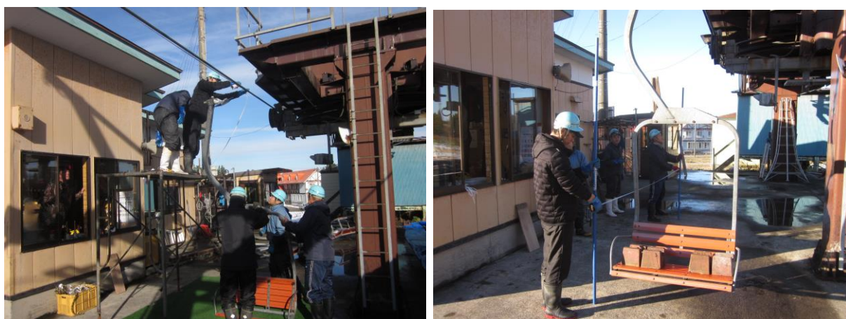
●輸送機器の点検整備の様子

安全輸送に関する従業員の研修を定期的実施するとともに、整備細則に則り機器の点検整備や更新を行い、その結果については安全統括管理者へ報告を行いました。