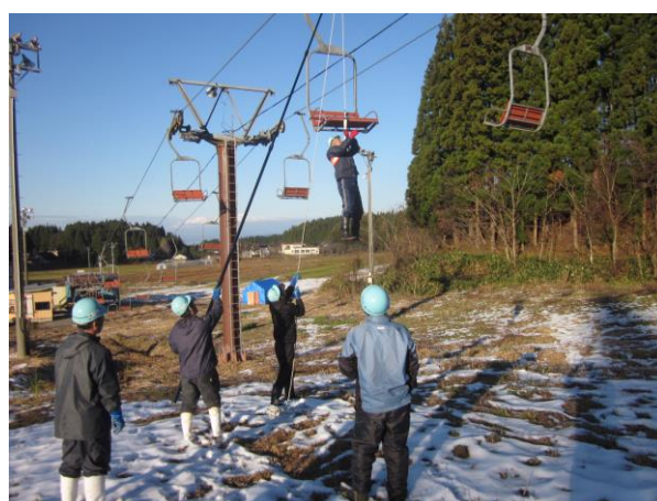
●リフト停止を想定した救助訓練の様子