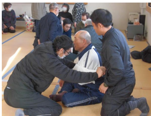
●応急処置対応の訓練の様子