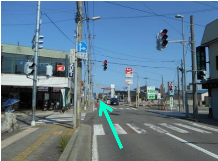
③ ②の案内表示のところから3つ目の信号、右にお茶屋や食堂、左にバイク販売店がある上の写真の交差点に来ますので、直進します。