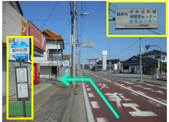
④ ③の交差点を過ぎるとすぐに、中央公民館への案内表示がありますので左折します。鶴岡駅や市役所方面からバスでお越しの際は、ここで降りて下さい。