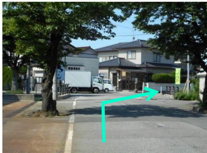
⑤ ④を曲がり少し進むと道路が右に曲がっておりますので、道なりに進んでください。