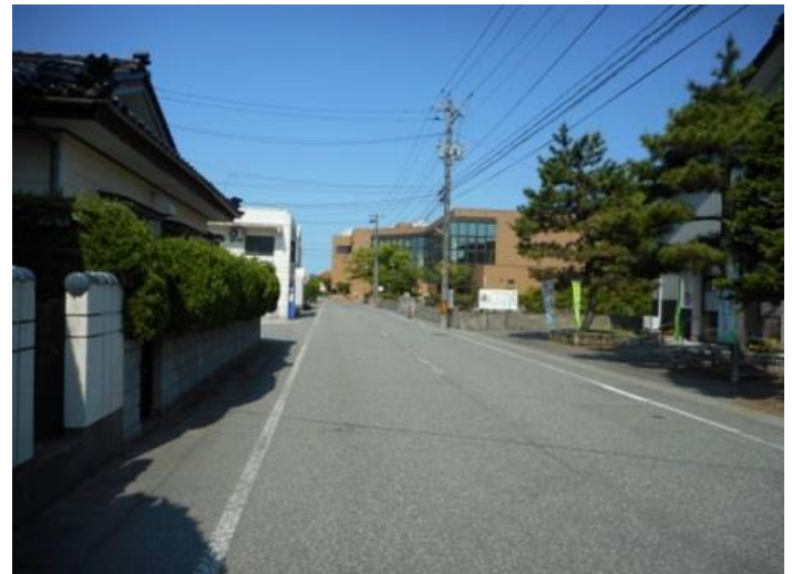
⑥ 道なりにしばらく進むと、右側にみどり町公民館・女性センター・中央公民館の順に見えてきます。