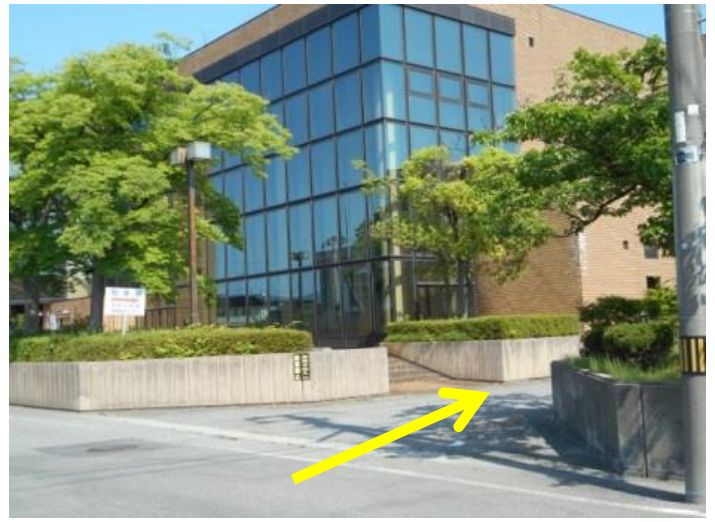
⑧ 中央公民館外観 中央公民館と女性センターの間の通路(黄色の矢印)の奥にも駐車場がありますが、大きいイベントの際には関係者用の駐車場となり、駐車が出来ない場合があります。