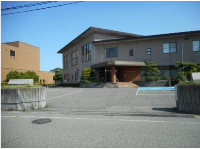
⑦ 女性センター外観 中央公民館をご利用の際は許可が無い場合は、こちらへ駐車をしないようにしてください。