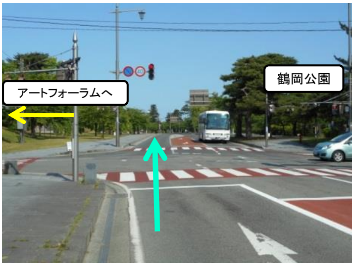
① 鶴岡市役所正面から西(大山・加茂方向)へ向かうとすぐに信号があるので直進します。