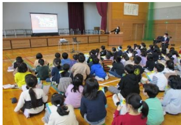
(小学校での食文化授業)