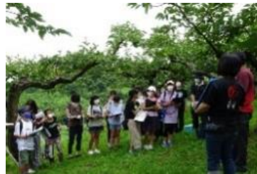
(フィールドワーク)