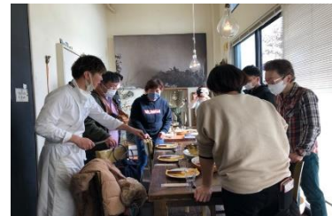
(食文化創造アカデミー)