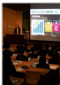
SB Student Ambassador 東北大会