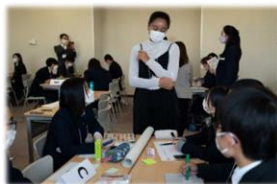
サステナブル・ブランド国際会議 学生招待プログラム