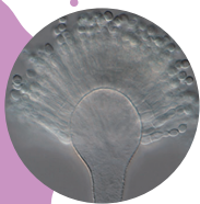
コウジカビ 顕微鏡拡大写真

食の基本となる水、そしてキノコ、山菜、野菜、海藻、魚介類といった世界でも有数の生物多様性を持つ日本列島がもたらした食材や、人々の食への飽くなき挑戦によって生み出された発酵の技術や出汁について、科学的な視点で解説します。