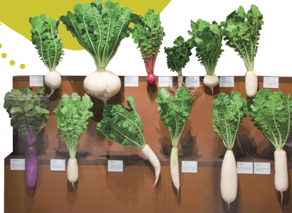
多彩な地ダイコン レプリカ 国立科学博物館 (東京会場での展示)