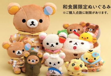
和食展限定ぬいぐるみ ※ご購入点数に制限があります。

誕生20周年を迎えた大人気キャラクター・リラックマ。ごはんとおやつが大好きなリラックマたちが、和食をイメージした装いで本展を盛り上げます。本展オリジナルイラストのグッズや、お弁当ぬいぐるみなど、たくさんの限定グッズを販売します。