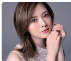
音声ガイド料金(税込) お一人様1台 500円

乃木坂46の卒業後、女優、ファッションモデルとして活躍し、和食好きで料理にも慣れ親しむ白石麻衣さんが、音声ガイドナビゲーターに初挑戦!おいしい「和食」の世界を楽しく案内します。