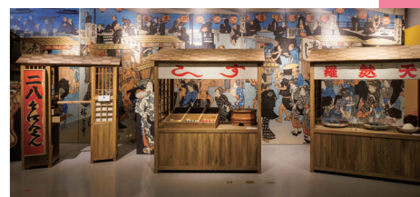
江戸時代の屋台の再現 (東京会場での展示)