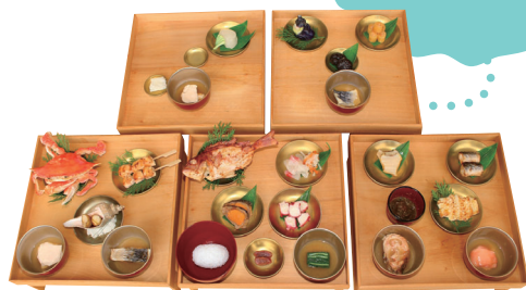
織田信長が徳川家康をもてなした本膳料理の再現模型 奥村彰生監修 御食国若狭おばま食文化館蔵